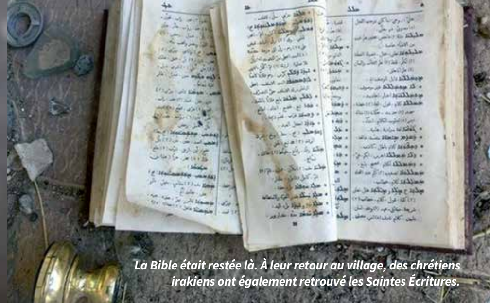
La Bible était restée là. À leur retour au village, des chrétiens irakiens ont également retrouvé les Saintes Écritures.