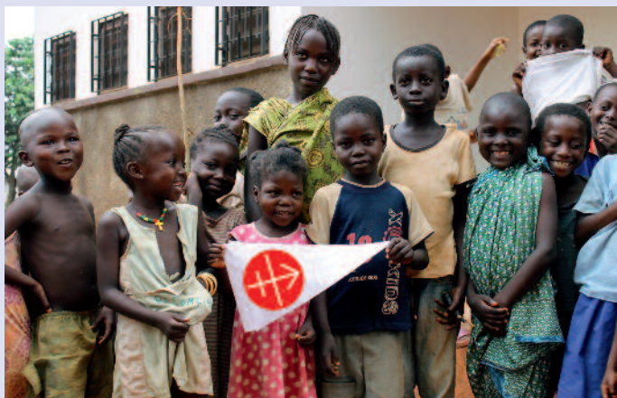
Leur avenir est aussi le nôtre : ces enfants de Centrafrique vous remercient.

L'augmentation des demandes d'aide en provenance d'Afrique reflète aussi la croissance de l'Église sur ce continent qui représente aujourd'hui 34 % de toutes les demandes. Une attention particulière a été accordée aux pays du Sahel, au nord du Nigeria, au Kenya, à la Tanzanie et à Madagascar – pays où une forme agressive d'islam se répand. Au Proche-Orient, berceau du christianisme, l'aide d'urgence ou à la subsistance occupe une place centrale. Elle garantit la présence des chrétiens dans la région. En Asie, l'Église a besoin d'aide, non seulement dans les pays subissant le joug communiste – Chine, Vietnam, Laos – mais aussi et de plus en plus dans les pays où l'hindouisme radical ou l'islam plongent les chrétiens dans la détresse, comme en Inde et au Pakistan, ainsi que dans certaines parties des Philippines. En Europe centrale et orientale, les projets sont passés de l'aide à la construction à l'aide à la formation. Dans cette partie du monde, l'attention se concentre surtout sur les pays des Balkans où des formes d'islam radical rendent la vie des chrétiens difficile. Notre solidarité aide aussi les chrétiens de ces régions à rester fermes dans la foi.