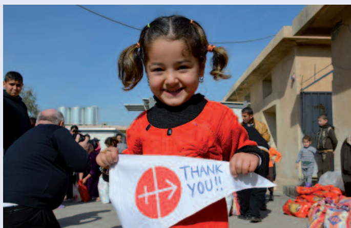
« Sans vous, nous n'aurions pas d'avenir » : les remerciements de cette petite fille valent pour des millions de chrétiens.